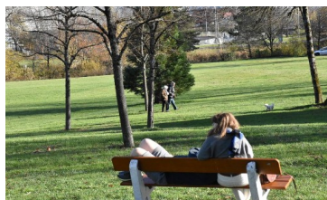
Parc de la fraternité